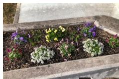
♡花壇には冬の季節の花が元気に咲いています♡