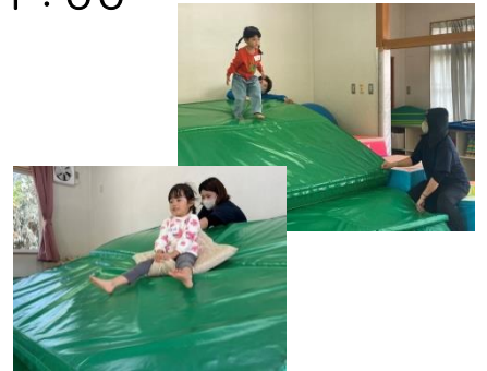
忍者修行でさかのぼりに挑戦したよ!