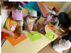
春に植えたサツマイモを収穫して、みんなで芋ごはんを作って食べたよ★

おもちゃつきごっこや節分など、その季節ならではの遊びを親子で一緒に楽しみましょう♪ 忍者になりきっていろんな遊びにもチャレンジしますよ!